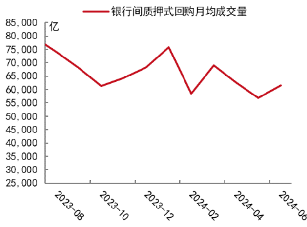
图 2 6 月银行间质押式回购成交额出现回升